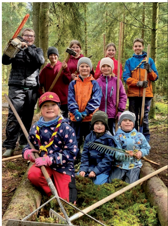
Fleissige Helfer am Waldfreudetag 2023