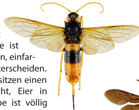
Riesenholzwespe, Urocerus gigas

Die Riesenholzwespe , Urocerus gigas , ist eine Pflanzenwespe deren Larven sich von Holz ernähren. Diese schwarz-gelb gefärbte Wespe ist durch ihren zylindrischen Körper und ihre langen, einfarbig gelben Fühler, leicht von Hornissen zu unterscheiden. Weibchen können 45 mm lang werden und besitzen einen langen Legebohrer, der es ihnen ermöglicht, Eier in Holzstämmen abzulegen. Die Riesenholzwespe ist völlig harmlos.