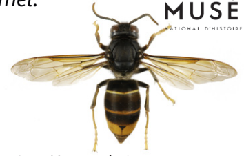
Asiatische Hornisse, Vespa velutina

Die Europäische Hornisse , Vespa crabro , hat einen überwiegend blassgelben Hinterleib mit schwarzen Streifen. Die Kopfvorderseite ist gelb, die -oberseite rotbraun gefärbt. Brust und Beine sind schwarz und rotbraun. Arbeiterinnen erreichen eine Körperlänge von 18 bis 23 mm, Königinnen 25 bis 35 mm.