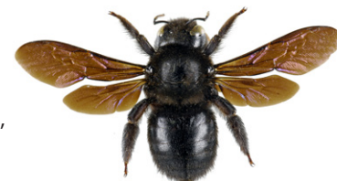
Blaue Holzbiene, Xylocopa violacea

Die Blaue Holzbiene , Xylocopa violacea , ist 20 bis 30 mm lang, vollkommen schwarz gefärbt und schimmert violett-blau. Die Weibchen dieser Solitärbieneart bauen ihre Nester in mürbem Totholz und sammeln Pollen als Nahrung für ihre Brut.