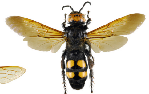
Rotstirnige Dolchwespe, Megascolia maculata

Die Blaue Holzbiene , Xylocopa violacea , ist 20 bis 30 mm lang, vollkommen schwarz gefärbt und schimmert violett-blau. Die Weibchen dieser Solitärbieneart bauen ihre Nester in mürbem Totholz und sammeln Pollen als Nahrung für ihre Brut.