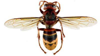
Europäische Hornisse, Vespa crabro

Die Orientalische Hornisse , Vespa orientalis , entspricht in der Körpergröße der Europäischen Hornisse. Sie hat eine rotbraune Grundfärbung, lediglich die Kopfvorderseite sowie eine Binde um den Hinterleib sind gelb. Sie kommt nur in Südosteuropa vor (Süditalien, Malta, Albanien, Griechenland, Zypern, Rumänien, Bulgarien).