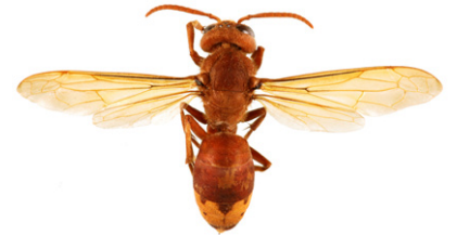
Orientalische Hornisse, Vespa orientalis

Wespen sind kleiner als Hornissen. Arbeiterinnen werden im Spätsommer etwa 15 mm lang. Es ist zu beachten, dass Wespenköniginnen etwas größer als 20 mm werden können, also etwa so groß wie die hier abgebildete Asiatische Hornisse ohne den Kopf. Im Frühling können Wespen daher größer als die ersten geschlüpften Hornissen-Arbeiterinnen sein.